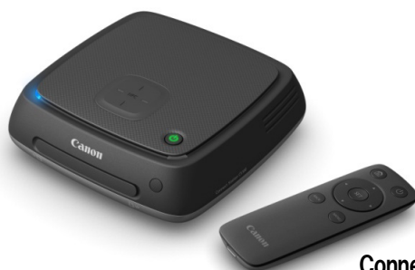
Connect Station CS100

キヤノンは、デジタルカメラなどで撮影した写真・動画の新しい楽しみ方を提供する新コンセプトの製品“Connect Station CS100”を2015年6月より発売します。